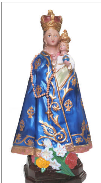
Immagine della Madonna di Madhu, venerata nello Sri-Lanka il cui popolo l'appella semplicemente con «Mama»

semplice riflessione di catechesi attualizzata e non aveva la presunzione di essere esaustiva. Con piacere riporto una riflessione che mi è stata inviata: - ... Ho condiviso in pieno tutto ciò che hai scritto. Se posso permettermi, avrei solo aggiunto anche questo: Penso a quei figli che si prendono cura con amore e dedizione dei propri genitori anziani, non lasciandoli soli e nell'abbandono. Una categoria che potevi citare. Ho pensato, in questa società dello scarto, a tutte quelle persone che spendono il proprio tempo e la propria vita per star